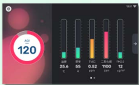
清新 - 暗色