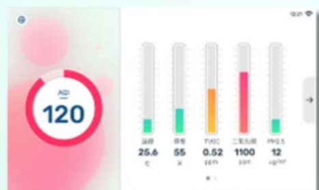
清新 - 亮色